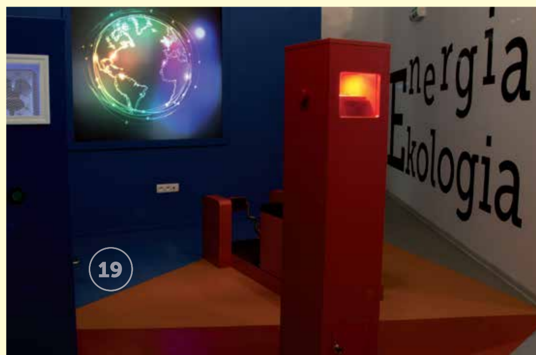
fol. Paweł Długosz